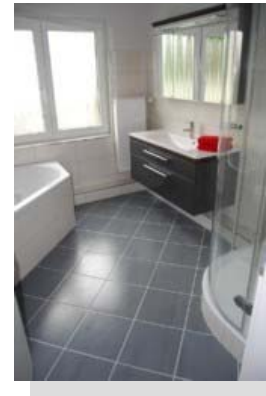
Ein luxuriöses Bad